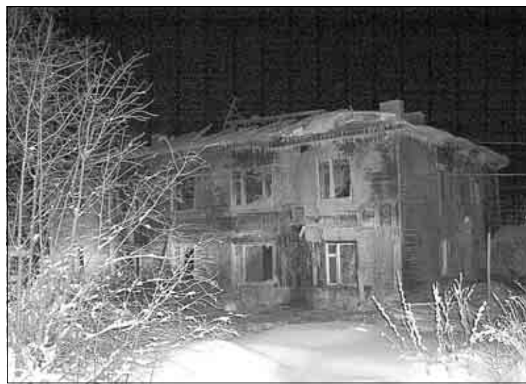
На фото автора: сгоревший 8-квартирный дом в Сторожевске.

Эдуард ПИМЕНОВ (в материале использованы сообщения информагентств).